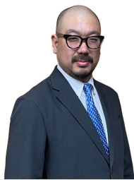
株式会社 ノダキ 代表取締役社長