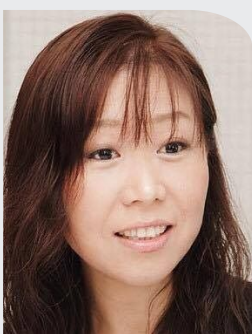
一般社団法人コミュニティヘルス研究機構 機構長・理事長/慶應義塾大学医学部衛生学公衆衛生学教室

社会情勢や自然災害、国際情勢の影響など、企業を取り巻くリスクは年々変化しており、中小企業においても増加するリスクへの対策が重要です。リスクに直面した場合の資金繰りに有効な損害保険。中小企業リスクに備える保険はいろいろありますが、そのなかでも近年脅威となっている自然災害リスクとサイバーリスクに係る保険について説明いたします。