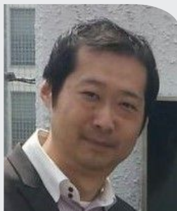
一般社団法人 日本損害保険協会 中部支部事務局長

ノダキグループは2012年からBCPIに取り組み、2021年に経済産業大臣認定を取得。策定から従業員への浸透、改善まで徹底し、企業の強靱性向上を実現。専門知識と実績で多くの企業から注目されている。