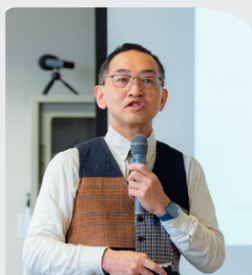
名古屋市立大学大学院 経済学研究科教授